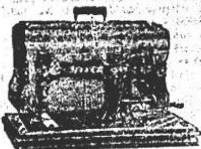
JONES' SEWING MACHINES

Depozit de Mașini de cusut originale Jones (Engleze)